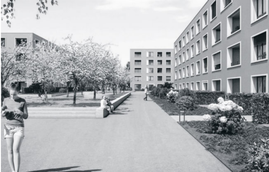
1 Neubauprojekt in Wil SG, St.Gallerstrasse 25/27/29/31